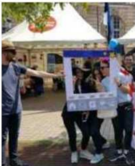
Le Village européen était installé sur la place Jean-Jaurès.