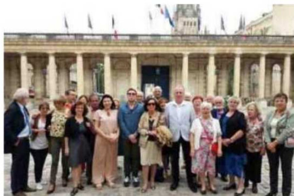
Les adhérents du comité, réunis dans la cour du Palais Rohan vendredi soir.

Des discussions pour intégrer de nouvelles communes jumelées ? Pour l'instant, il n'en est pas vraiment question. « Cinq villes, c'est déjà lourd pour entretenir de vraies relations. Nous sommes sollicités,