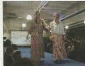
Le défilé de mode a connu un beau succès l'an dernier.