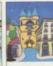
Kia, l'Art joyeux