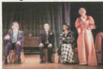
La poudre aux yeux sur les planches du théâtre de la Pergola.